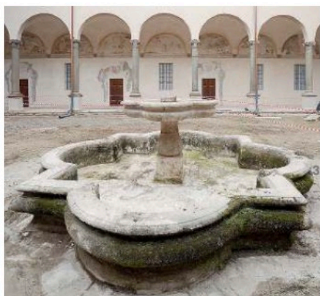
I LUOGHI Il Chiostro della fontana, anche visto dall'alto, e la Madonna del latte ancora semicoperta. Sotto: Alinovi.

La visita, con il supporto delle guide del Fai, ruoterà intorno al Chiostro della fontana, tra Camera di San Paolo e biblioteca Guanda, il primo che si incontra entrando da vicolo delle Assi. Passando dall'atrio, dove sono state riportate alla luce tracce di affreschi duecenteschi, si entrerà nel chiostro dalle fattezze rinasci-