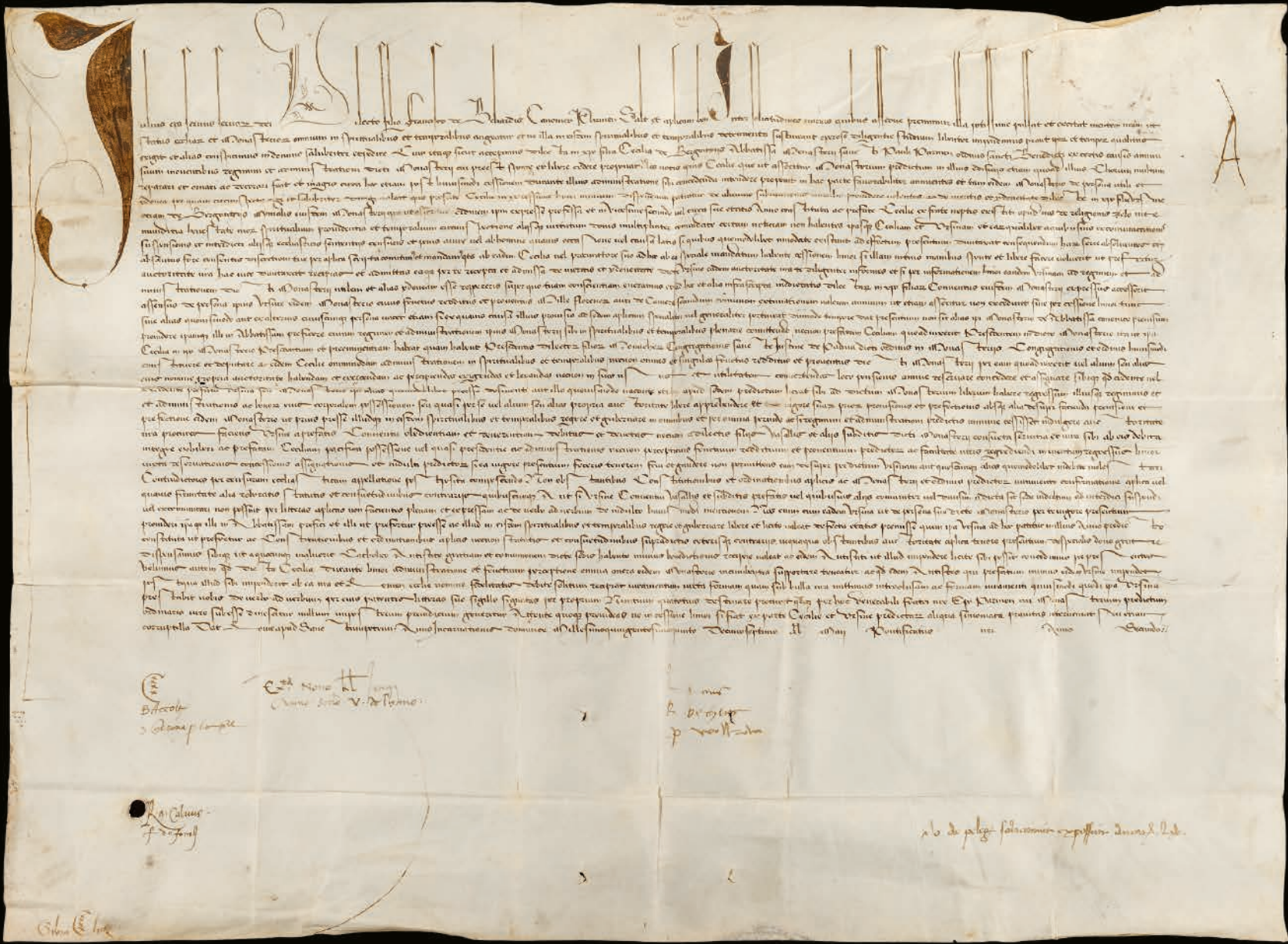
Fig. 5 - Bolla pontificia di Giulio II del 15 aprile 1505, Archivio di Stato di Parma, Diplomatico, Documenti Pontifici